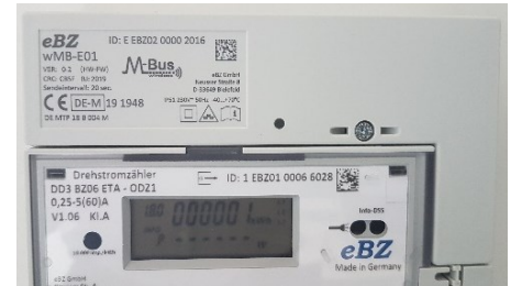
Aufsatzadapter wireless M-Bus für den DD3

Unsere Umsetzung der OMS-Spezifikation wireless M-Bus, im Aufsatzmodul wMB-E01 (BAB für den DD3) und beim WD3 mit integrierter Funkplatine, wurde sofort von den BSI-Gateway Herstellern und unseren Kunden anerkannt.